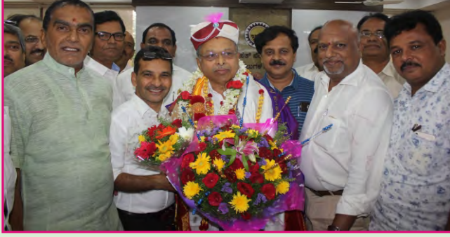
ಅಧ್ಯಕ್ಷ ಶ್ರೀ ಚಂದ್ರಶೇಖರ ಹೆಬ್ಬಾರ್ ಅವರಿಗೆ ಅಭಿನಂದನೆ