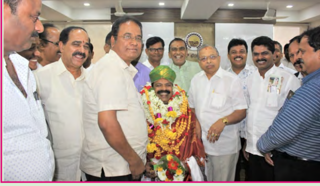
ಉಪಾಧ್ಯಕ್ಷ ಶ್ರೀ ರವಿಶಾಸ್ತ್ರಿ ಅವರಿಗೆ ಅಭಿನಂದನೆ